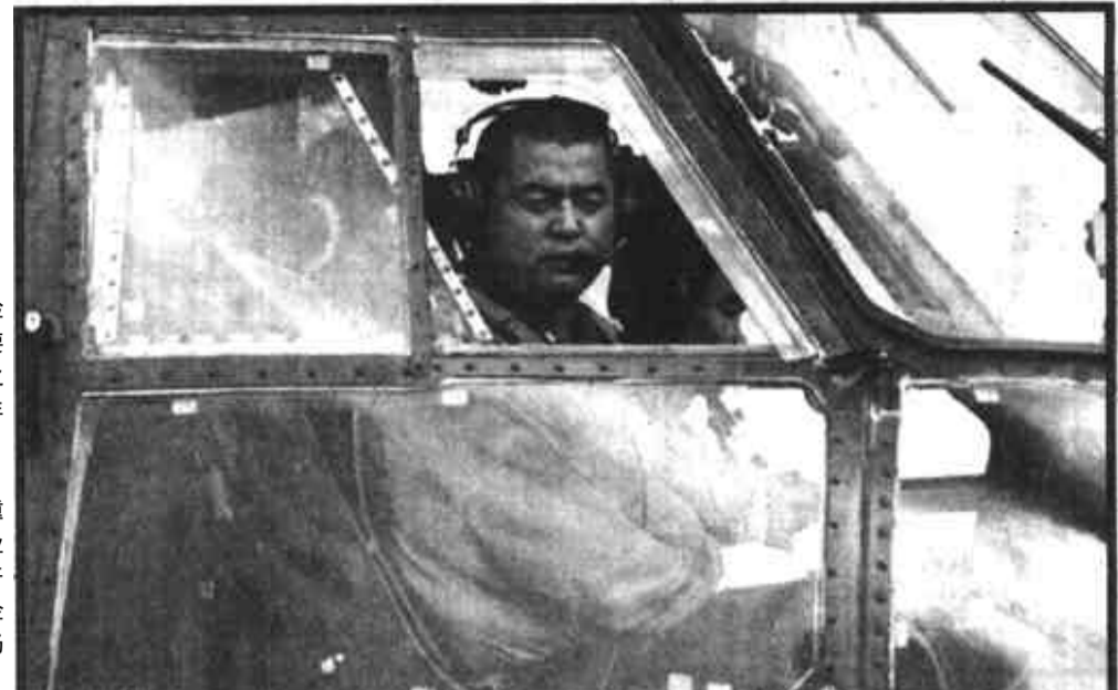
4月10日,是我军飞行员王伟失踪的第10天。南海舰队派出的飞机、舰艇和海南、广东的大量民船,继续在海南岛东南海域搜寻王伟的下落。

游企业和旅游者索要回扣的行为,导游讲解不规范的行为等。在旅游经营秩序方面,重点打击无证经营和超范围经营的单位和个人;以商务考察、出国培训、友好交流等名义,变相招徕、组织出境旅游特别是到非目的地国家旅游的行为;发布或刊登虚假广告、诱骗旅游者的行为;在旅游接待和服务中,进行欺诈性宣传、招徕和接待的行为。“五一”、“十一”、春节三个“黄金周”之前要对旅游市场进行全面检查,排查隐患;“黄金周”期间,要深入旅游区现场执法;“黄金周”之后,要及时妥善处理旅游投诉。今年出境旅游市场整顿范围将由新、马、泰扩大到港澳地区。