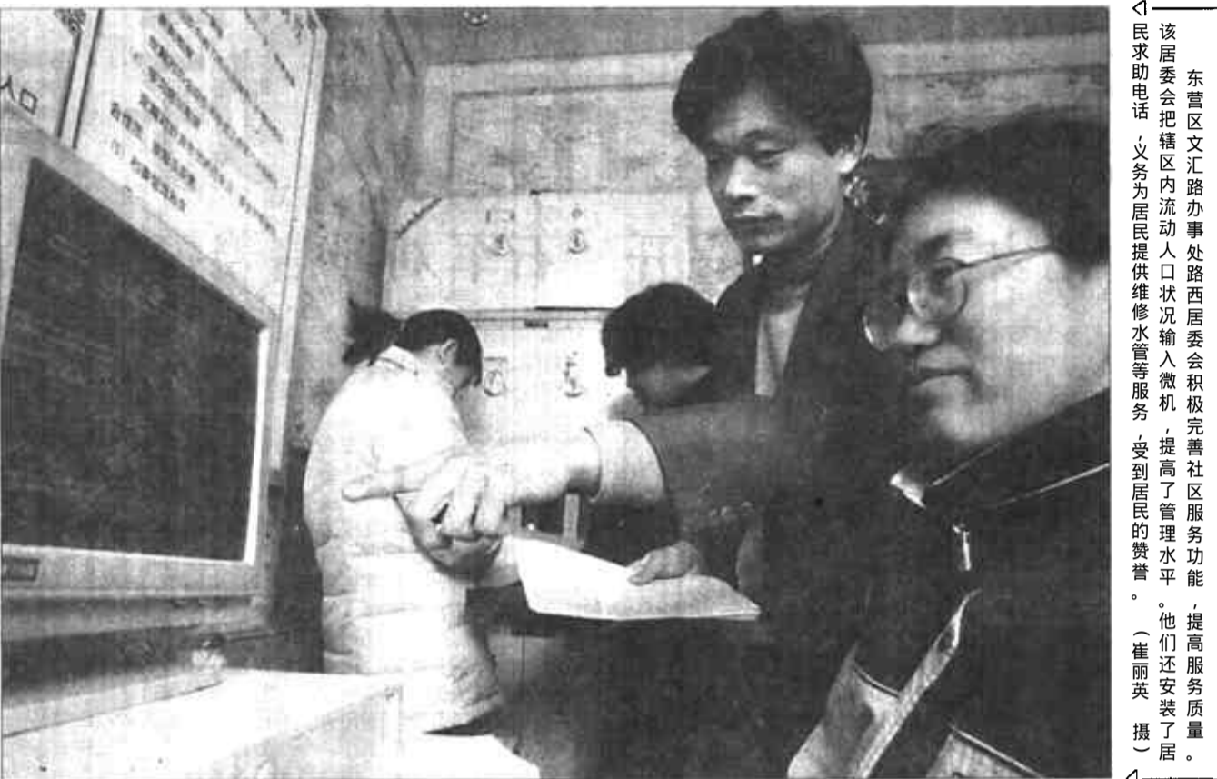
东营区文汇路办事处路西居委会积极完善社区服务功能,提高服务质量。他们还安装了居民求助电话,义务为居民提供维修服务,受到居民的赞誉。

本报讯 近日,全市人大法制工作座谈会召开。会上,各县区人大法制部门围绕如何履行职权,上下联动,做好内务司法工作总结交流了工作经验,并介绍了今年的工作打算。