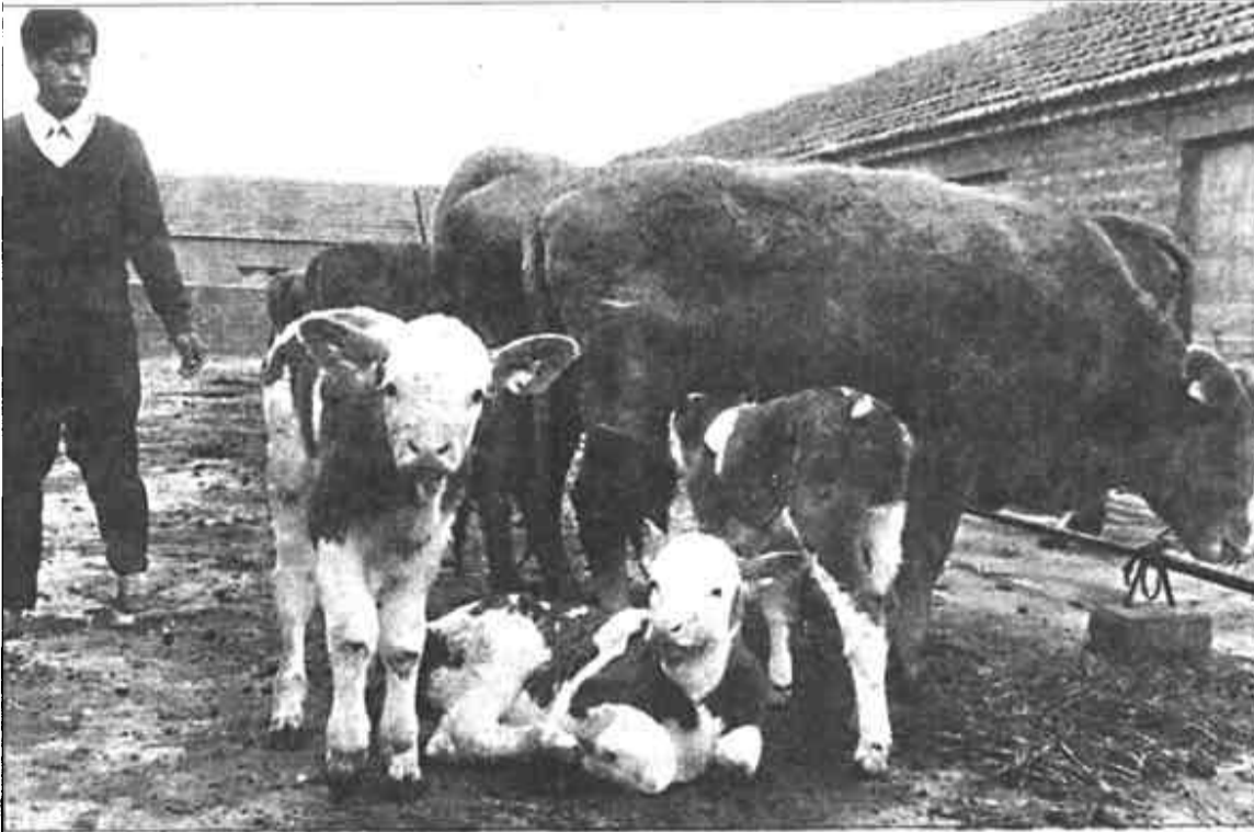
由省农科院推广、广饶县陈官乡承办的“肉牛胚胎移植”项目获得成功。到4月9日，已有24头本地黄牛通过胚胎移植生下25头纯种加拿大西门塔尔牛犊，小牛犊长势良好。据介绍，通过胚胎移植对本地黄牛进行改良，经济效益可成倍提高，是农民增收的一条可行的路子。